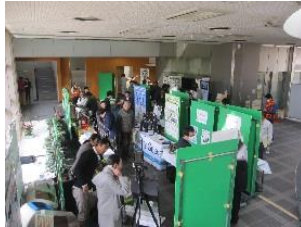
●実施事業:鳥獣被害防止総合対策交付金