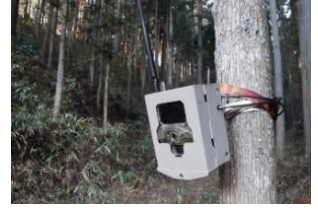
●実施事業:鳥獣被害防止総合対策交付金