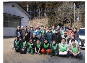
●実施事業:中山間地域元気創出事業(とちぎ夢大地応援団カレッジ事業)