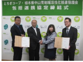
●実施事業:企業連携促進事業(中山間地域元気創出事業)